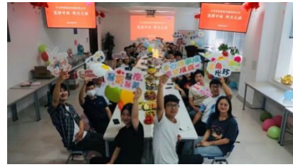
情暖中秋，欢度佳节