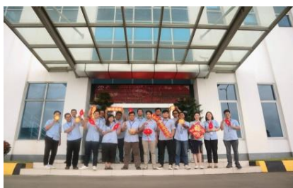
中外员工共同欢度中国传统节日春节