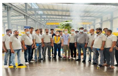
中天印度庆祝传统节日“Pooja 蒲迦节”