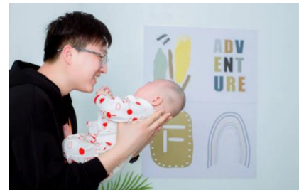
“最炫父亲”摄影比赛