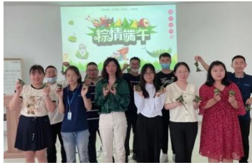
箬叶飘香，端午安康